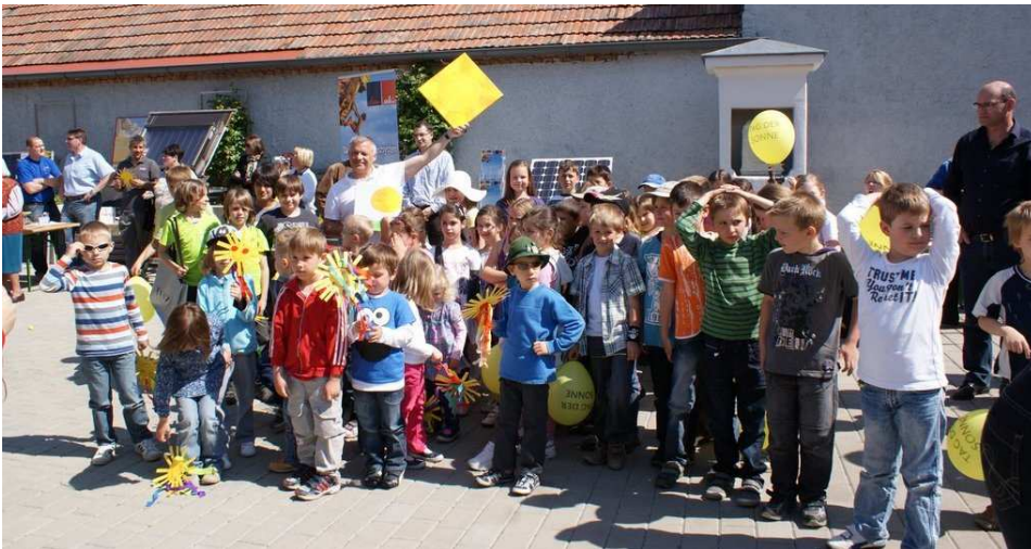
Die Kinder des Kindergartens und der Volksschule mit Bgm Gerald HANDIG beim Tag der Sonne am 6.5.2011