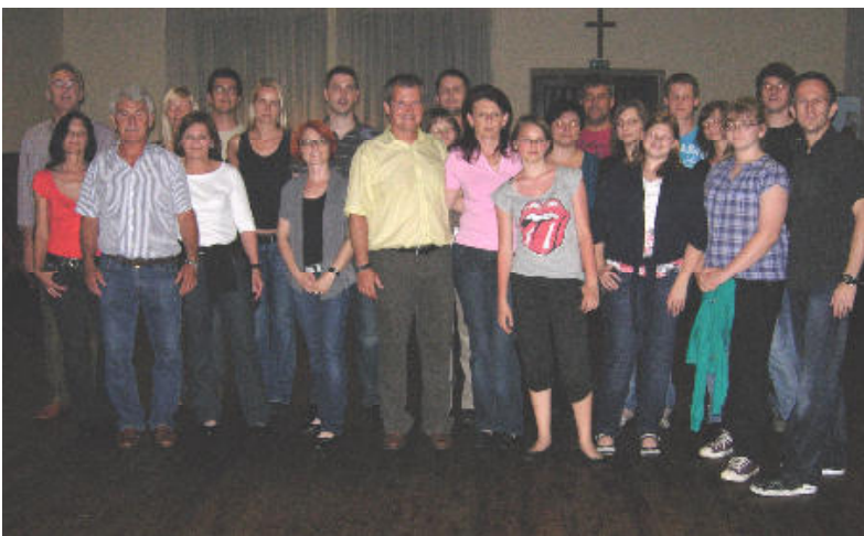
Die Teilnehmer des Tanzkurses

Am Donnerstag, den 15.7.10 um 19 Uhr (Gemeindeamt) informiert Bnet über den bevorstehenden Ausbau des Breitbandinternets über Kabel in unserer Gemeinde