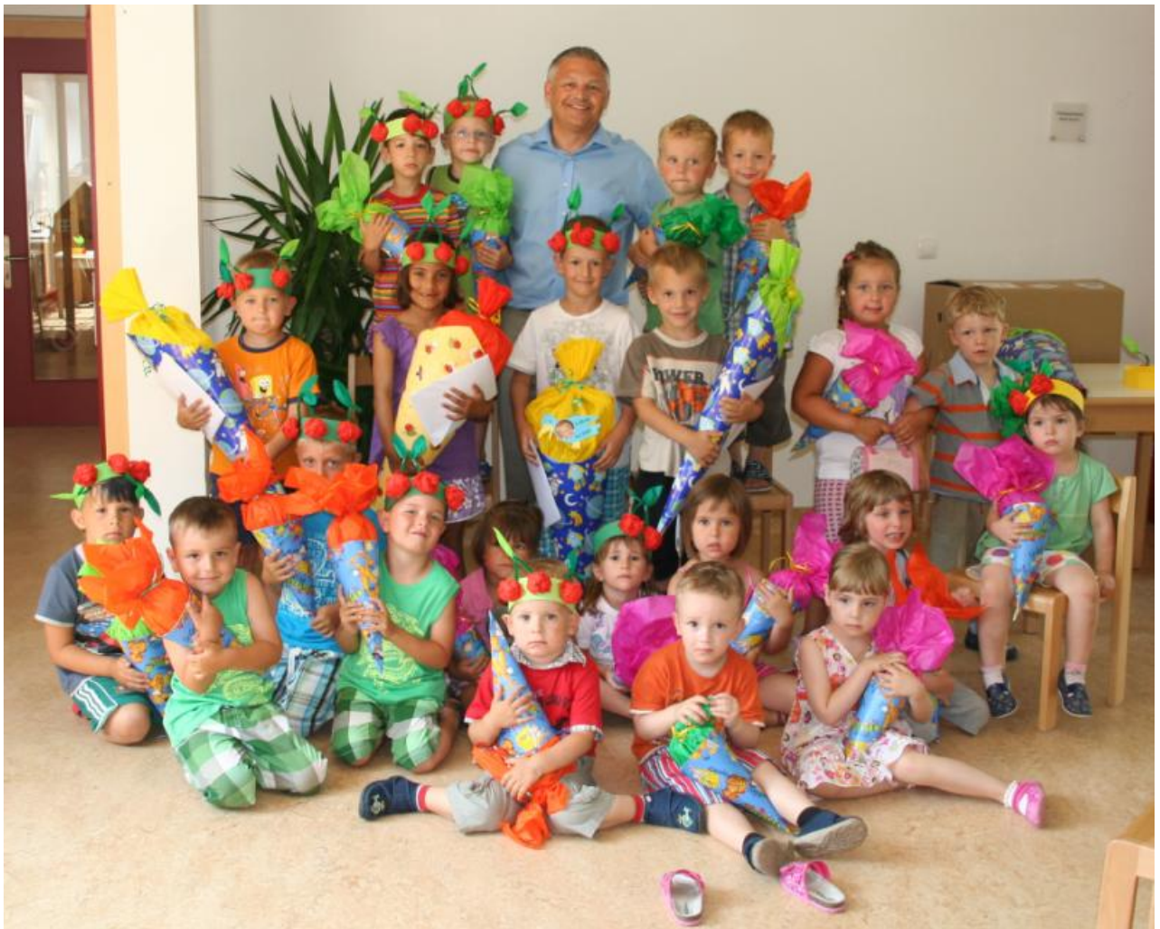
Bürgermeister Gerald HANDIG mit den Kindern des Kindergartens beim Schultütenfest