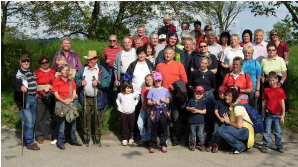
Naturkundliche Wanderung 2010