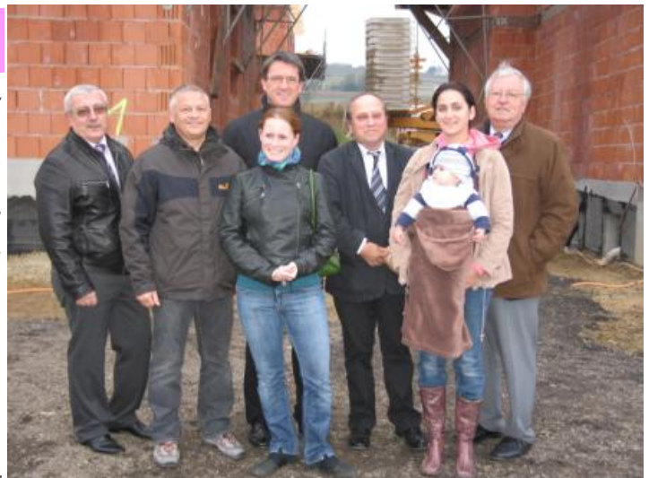
Bürgermeister Gerald HANDIG mit den Verantwortlichen der OSG, der Baufirma und mit zukünftigen Mietern bei der Gleichenfeier!

Die OSG erwägt bereits, 2011 den Bau von zwei weiteren Wohnblöcken zu beginnen. Die dafür erforderlichen Baugründe kauft die OSG von der Gemeinde und von WM-Real.