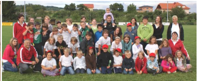
10 Jahre Sommerprogramm – Abschlussparty