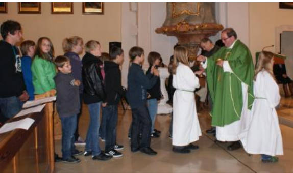
Am 25.9.10 wurde in unserer Pfarrkirche die Jugendmesse des Dekanats gefeiert