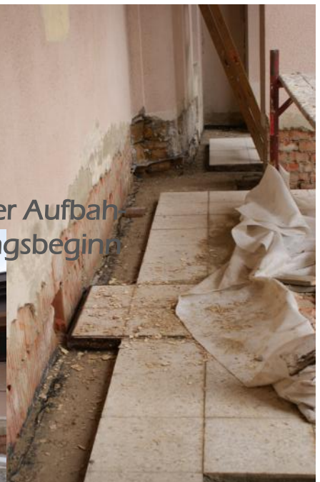
Schwere bauliche Schäden der Aufbah- rungshalle vor dem Sanierungsbeginn