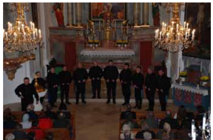
Konzert des URAL KOSAKENCHORES in der renovierten Pfarrkirche