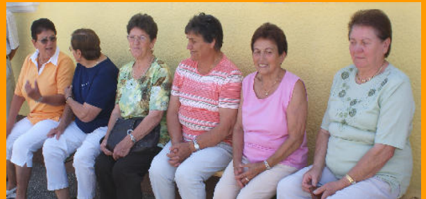
Rechts: „nicht auf die lange Bank geschoben“... - das Warten auf unser „Haus der Generationen“ hat ein Ende