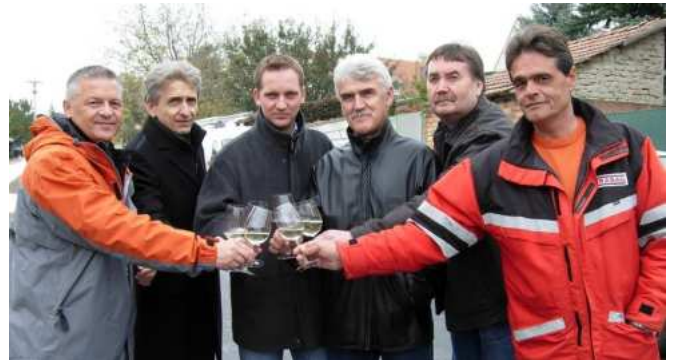
Nach der Fertigstellung lud die Fa. STRABAG die Anrainer zu einer kleinen Eröffnungsfeier und stieß mit den Verantwortlichen der Gemeinde auf das gelungene Projekt an.