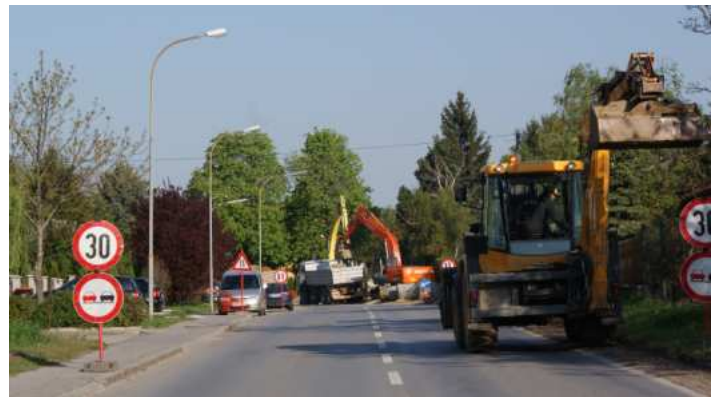
Kanalverlegung für das HWS-Becken 2 in der Badstrasse

Der Weiterbau der HOCHWASSERSCHUTZMASSNAHMEN wurde in Angriff genommen und soll abgeschlossen werden. Parallel zu den Erdbauarbeiten für das Becken 2 ( Herrschaftsjoch ) wurden beide Ableitungskanäle (auch für Becken 1, Oberer Neuriß ) errichtet.